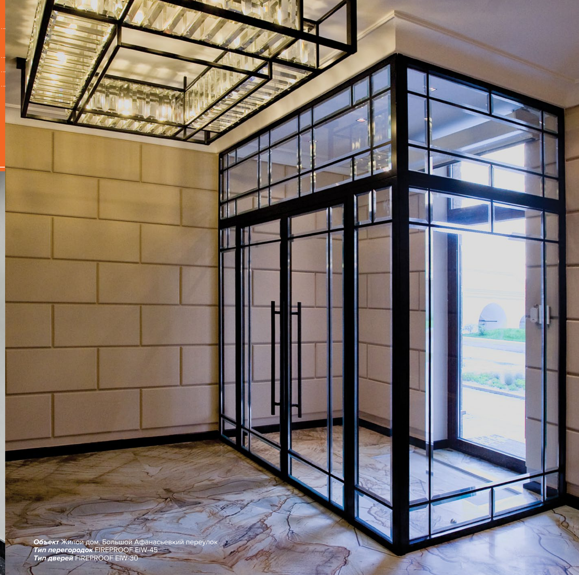
Объект Жилой дом. Большой Афанасьевский переулок Тип перегородок FIREPROOF EIW-45 Тип дверей FIREPROOF EIW-30

Применение сварочных работ при создании конструкций, выполненных из профиля VOESTALPINE, обеспечивает дополнительную прочность в местах соединения профилей, что позволяет создавать высокие перегородки и двери. Порошковая окраска защищает поверхность конструкции и сохраняет ее эстетическую привлекательность в течение многих лет.