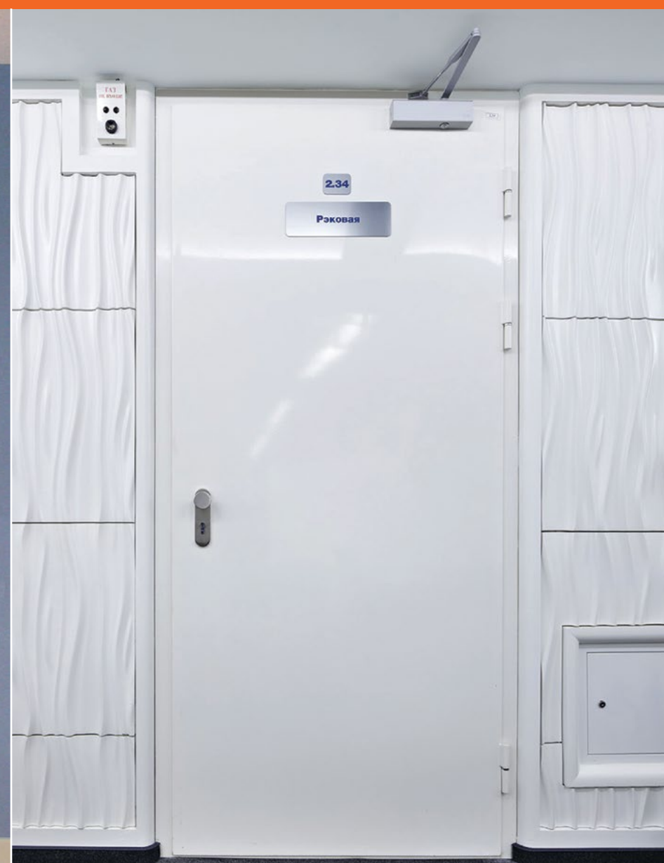
Объект Московская Межбанковская Валютная Биржа Тип дверей FIREPROOF EIW-60