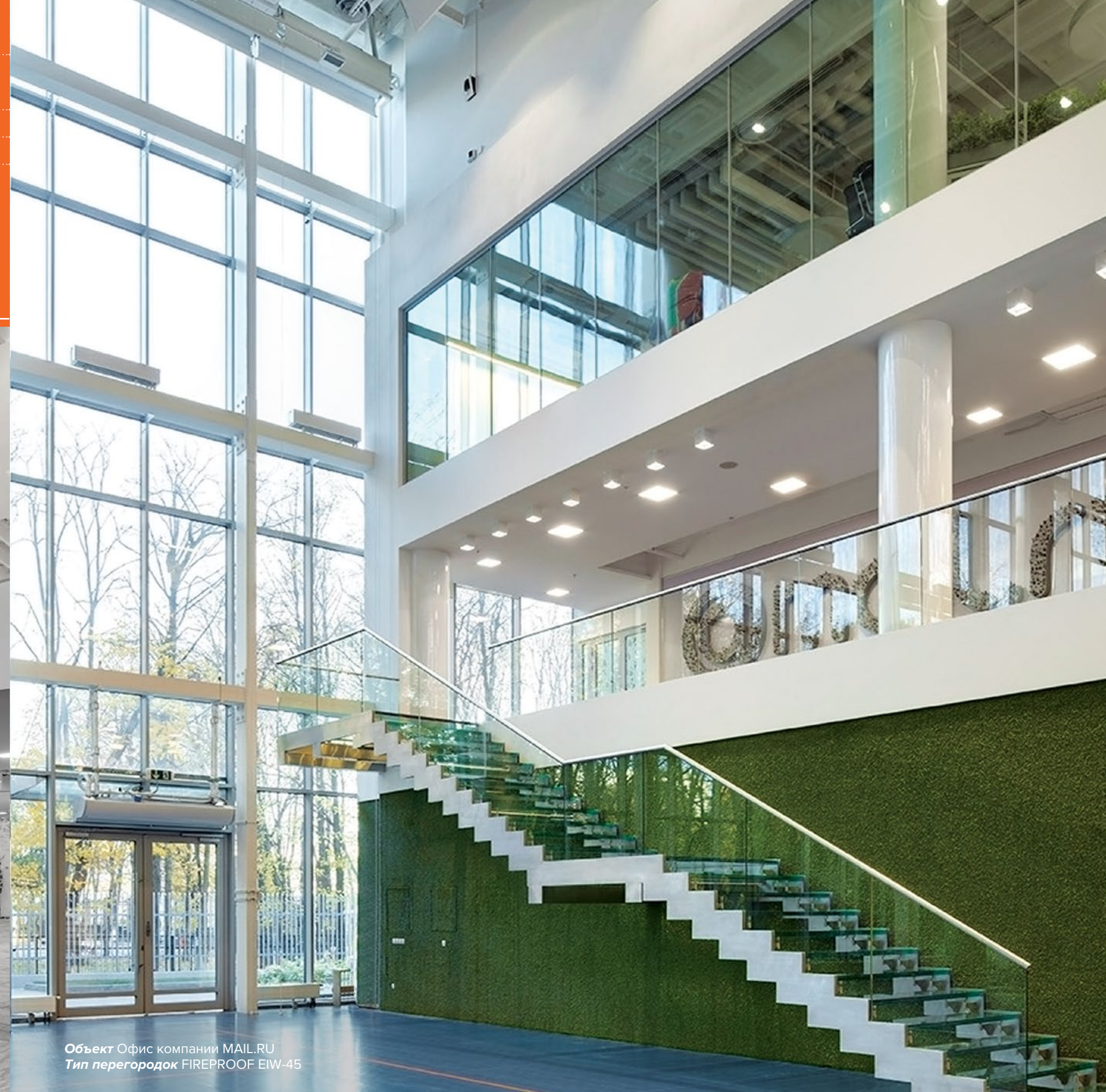
Объект Офис компании MAIL.RU Тип перегородок FIREPROOF EIW-45