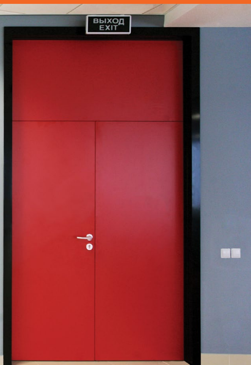
Объект Офис компании РЖД Тип дверей FIREPROOF EIW-60

Конструкция ламинированных дверей предусматривает наличие статичной верхней части коробки, куда устанавливаются скрытые доводчики и петли. Уплотнитель, зафиксированный по периметру дверного короба и выпадающий порог обеспечивают надёжную защиту от холодного дыма. Возможно остекление не более 25% поверхности.