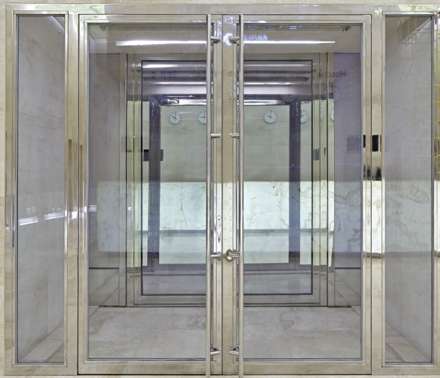
Объект Москва Сити. Башня Меркурий Тип перегородок FIREPROOF EIW-60 Тип дверей FIREPROOF EIW-60