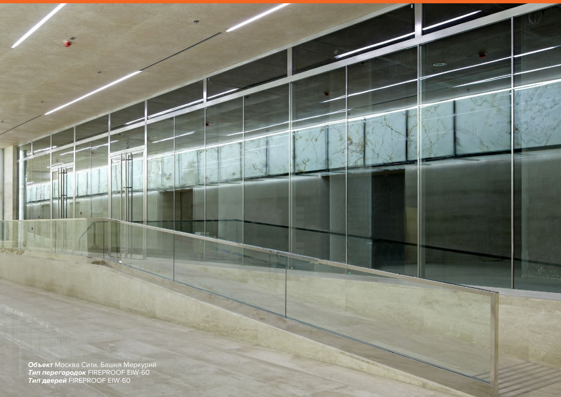
Объект Москва Сити. Башня Меркурий Тип перегородок FIREPROOF EIW-60 Тип дверей FIREPROOF EIW-60

Конструкции из профильных систем FORSTER обладают высокими технологическими характеристиками, устойчивы к коррозии и легко перерабатываются. Прочные соединения сварных углов позволяют создавать перегородки нестандартной высоты.